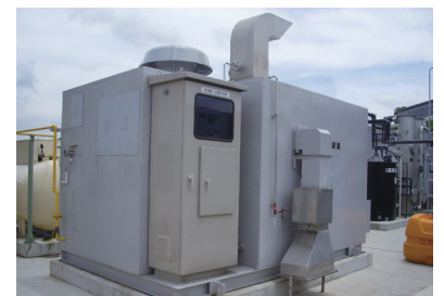
ガス処理装置(触媒酸化装置)