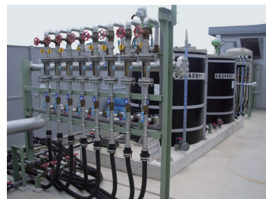
栄養塩・促進剤注入装置