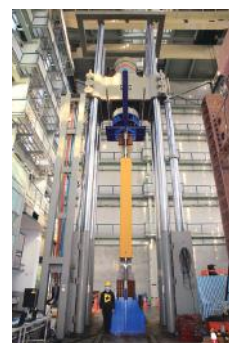
図3 台湾内政部・建築研究所試験機