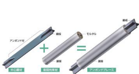
図1 UBBの基本コンセプト

疲労性能曲線((1)式及び(2)式)、上述の制振用UBB大軸力試験結果及び、既往の試験結果(いずれも板厚40mm以下)より得られた疲労性能を図6に示します。疲労性能曲線と試験結果はよく一致しており、大軸力UBBであっても従来のアンボンドブレースとほぼ同等の性能を有していることが確認できます。