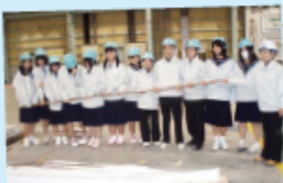
※ITER(国際熱核融合実験炉)の超伝導コイル用導体を製作

地域交流の一環として、近隣の中学校の科学部員12名と顧問の先生が参加しました。中学生にとっては難しい内容の説明もありましたが、科学に興味を持つ生徒さんだけに表情は真剣そのもの。「昔から不思議に思っていた長い工場の謎が解けてよかった」「国際協力プロジェクトに携わっているのがすごい!」など、地元工場への親近感も増したようです。