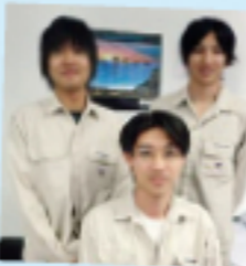
研修生とローカルコーチャー(前列)

今年は徳山高専、木更津高専から1名ずつを受け入れました。ロードアウト見学、溶接や加工、設計など、貴重な体験ができるプログラムを準備。3週間の日程の最終日には、2人とも英語を使っての成果発表プレゼンテーションを見事に披露しました。