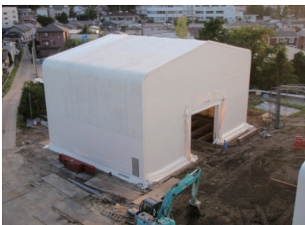
汚染サイト内に設置した仮設テント