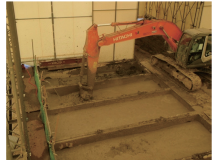
仮設テント内での攪拌混合