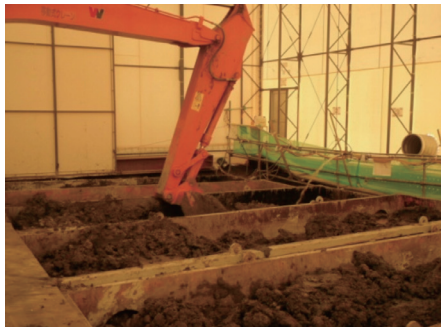
仮設テント内での酸化剤添加