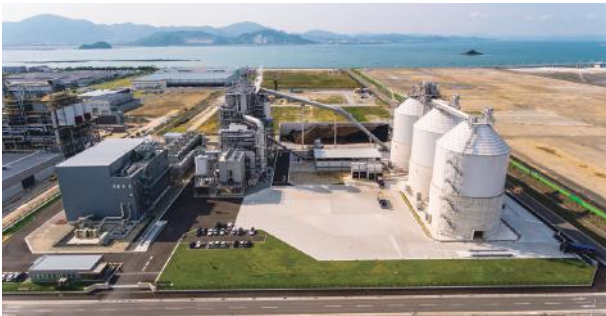
図1. 苅田バイオマス発電所全景

一般家庭約170,000世帯の使用電力量に相当する発電能力は、バイオマス発電設備としては日本最大級となる「苅田バイオマス発電所」。このたび、住友重機械工業(株)とのJVとして、その建設工事に参画し、竣工を迎えました。