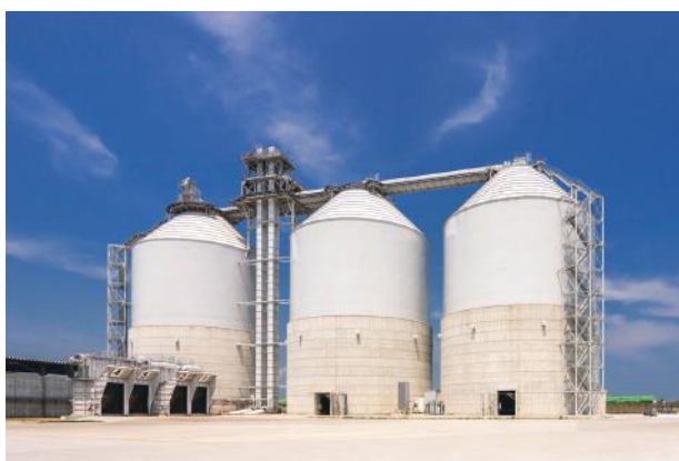
図2. 木質ペレットタンク

また、設備の配置・レイアウトに関しては搬送・搬出トラックの動線等、お客様と共同で検討することで、運用し易く最適なものとのことができました。