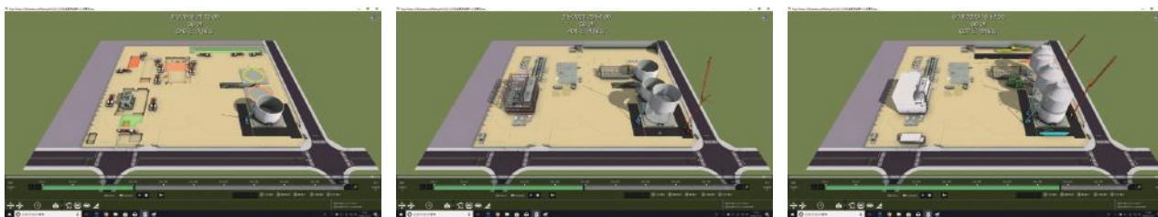
図6-1～3. BIM の例

計画を理解する必要があるため、本プロジェクトでは、3DBIM モデルに時間軸(工程)をインプットした4D による工事計画の見える化に取り組み、工事エリア、重機配置などの視覚的・直観的な理解に役立てました。プラント建設工事における BIM 活用の可能性を見出せた取り組みとなりました。