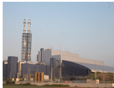
ストーカ炉焼却施設 建設地：イタリア・ナポリ 処理量：1,951トン／日(3ライン) 稼働年度：2009年