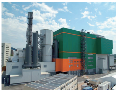
ストーカ炉焼却施設 建設地：ドイツ・ベルリン 処理量：864トン／日(1ライン) 稼働年度：2012年