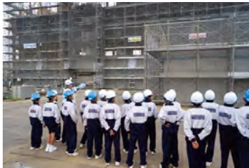
中学生を対象とした建設現場見学会