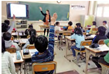
小学校出張授業の様子