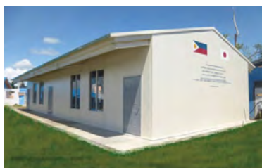
Palo National High School