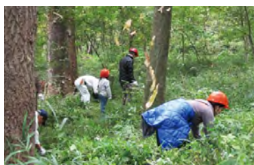
東京グリーンシップ・アクション (緑地保全活動)