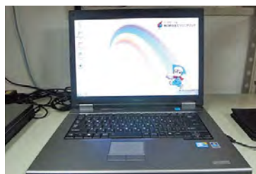
リユースパソコンの寄贈