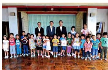
木のおもちゃ(積木)を寄贈した 福島県広野町の幼稚園