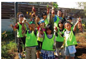
エンジ村での「サツマイモ掘り」体験

※「はじまるくん」＝支援企業より利用終了パソコンや寄付金（再生作業費などの実費）の提供を受け、パソコンの再生作業（クリーニングやOS導入など）を障がいをお持ちの方が働く福祉作業所に委託。その再生されたパソコンを福祉施設などへ寄贈するプログラムです。環境に貢献できるパソコン・リユースをベースとして、障がい者就労支援とIT支援をめざしています。