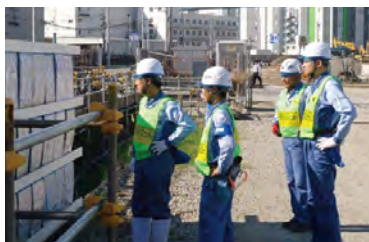
経営幹部による安全パトロール