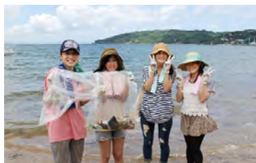
海岸清掃活動 (福岡県糸島)