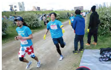
PARACUP2014 ～世界の子どもたちに贈るRUN～