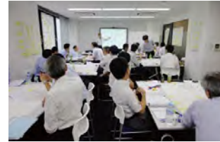
品質管理特別講座