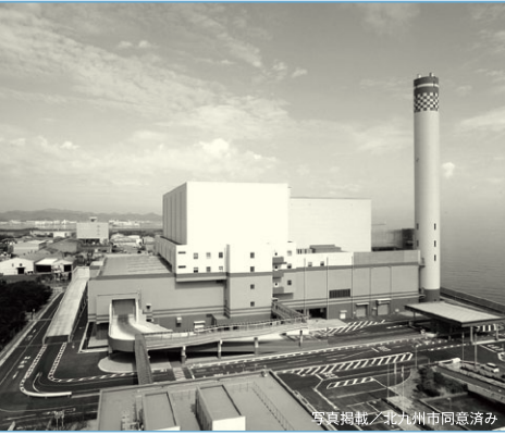
写真掲載/北九州市同意済み