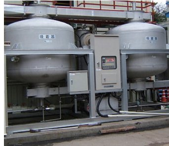
ガス処理装置(溶剤回収装置)