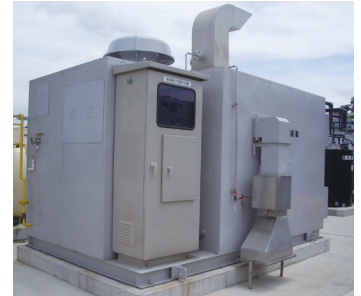
ガス処理装置(触媒酸化装置)