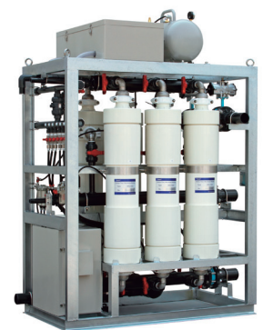
膜分離活性汚泥装置