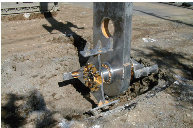
攪拌混合機 アタッチメント