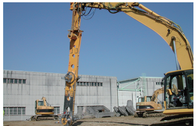
原位置での攪拌混合