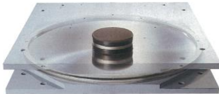
【NS-SSB ® 姿図】

※2 日本インシュレーション(株)が製造・販売する「表面塗装鋼板付けい酸カルシウム板」