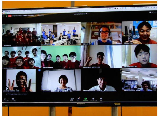
【 エネルギーアイランドプロジェクト：(左)プレゼンの様子、(右)全員オンライン参加の様子 】