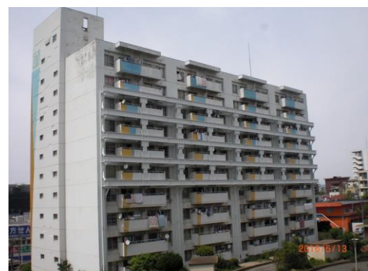
【NSビルプラス®Gの適用例】