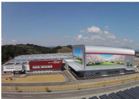
【三高テクノ工場 全景】