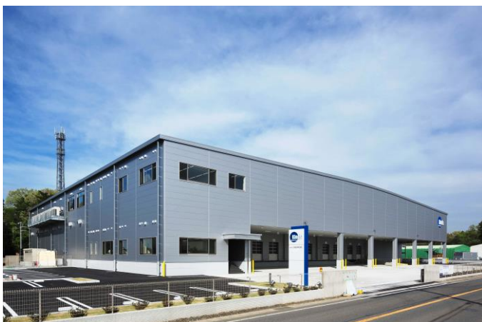
【本施設の外観写真】

新日鉄住金グループの一員として鋼構造分野に大きな強みを持つ当社は、物流施設を得意領域の一つとして実績を積み重ねております。引き続き、鋼構造エンジニアリングと鉄の知見を活かした商品・技術の提供を通じ、安心・安全な社会の実現に貢献してまいります。