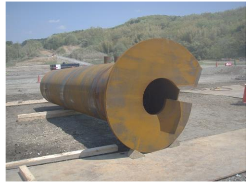
写真1 NSエコパイル外観

土木分野 (鉄道・道路施設、送電鉄塔等)、 建築分野 (公共施設、マンション・事務所ビル、工場設備等) で全国多数実績有り