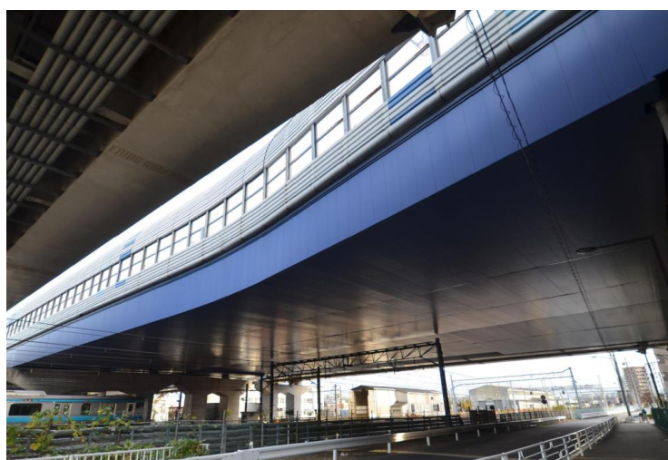
東日本高速道路株式会社／東京外環自動車道「東北線跨線橋常設足場設置工事」 （場所：埼玉県川口市 蕨駅～南浦和駅間）

当社はこれからも、社会的ニーズを確実に捉え、鋼構造エンジニアリング力と鉄の知見を活かした商品・技術を通じ、安心・安全な社会の実現に貢献してまいります。