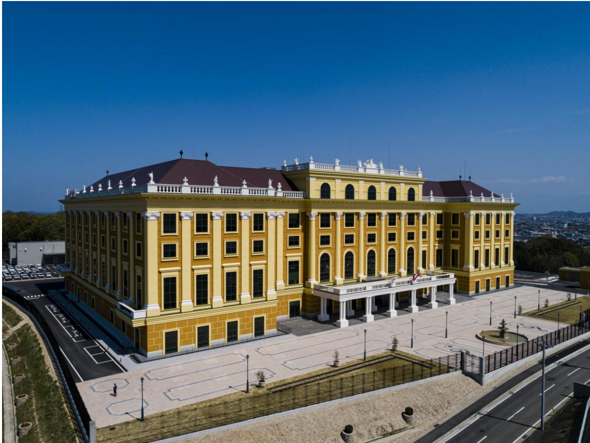
【「シェーンブルン宮殿工場」外観】